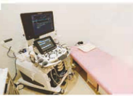
各部屋には最新鋭の機器がそろう。