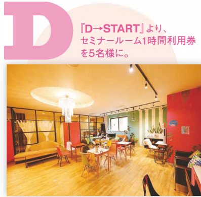
「D→START」より、セミナールーム1時間利用券を5名様に。