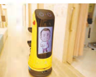
カルテを運ぶロボットも!