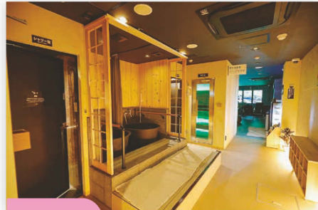
「sauna海かい」より、大衆サウナ60分利用券を3名様に。