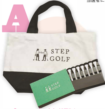
「STEPGOLF 広島 紙屋町」より、オリジナルトートバッグ&ティートを10名様に。

下のはがきを切り取るか、または、右下のQRコードから移動した専用応募フォームに、住所、名前、年齢、職業、電話番号、希望賞品名、本誌へのご意見・ご感想(本通のおすすめ店など)を明記の上、ご応募ください。 締切は10月31日(木)当日消印有効(フォームでの応募の場合は10月31日23:59)です。 当選者には引換券を郵送いたしますので、各店舗にてプレゼントとお引き換えください。