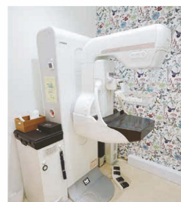
マンモグラフィーの検査室は花柄の壁紙。