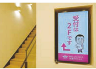
院長のイラストや人形なども。