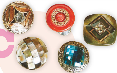
「マルエス原田」より、お好きなボタンブローチを5名様に。