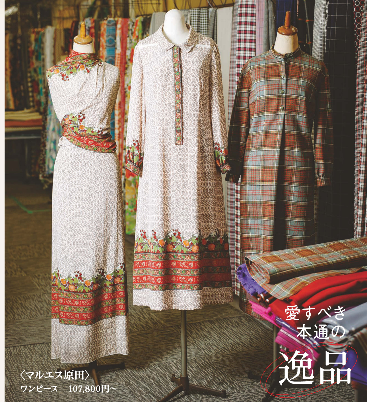
〈マルエス原田〉 ワンピース 107,800円〜