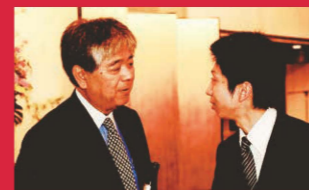
2014年、セブン-イレブン40年記念パーティーにて耕作さんと。

「2016年4月に社長を交代し、会社の経営をすべて任せました。若くして会社の全責任を負い、いろいろなたたの相克、人間関係などで最初は苦労したようです。今はいろいろな方々に可愛がっていただいて随分成長し、私の若い頃よりしっかりしています。本人は現在、飲食店を含む7店舗を運営し、忙しく頑張っています。これからも皆様のご指導の下、努力し続けてほしいです」